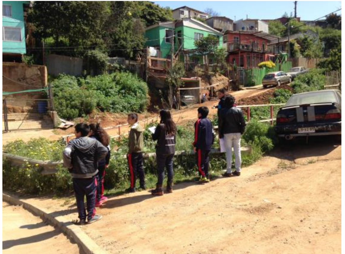
Barrio Héroes del mar, Cerro Placeres Valparaíso (04/2016)