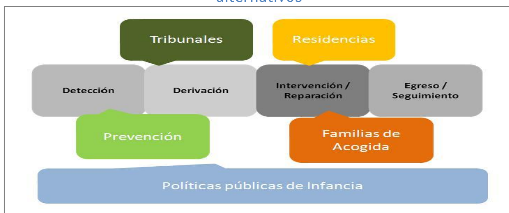
Figura 2: Momentos de intervención y actores del sistema de cuidados alternativos

La información fue analizada considerando los distintos momentos de la intervención y los distintos actores que intervienen; que permitiera tener un panorama respecto al funcionamiento de cada uno de ellos, y detectar los nudos o vacíos en las atenciones hacia los niños, niñas y adolescentes (NNA) y sus familias: